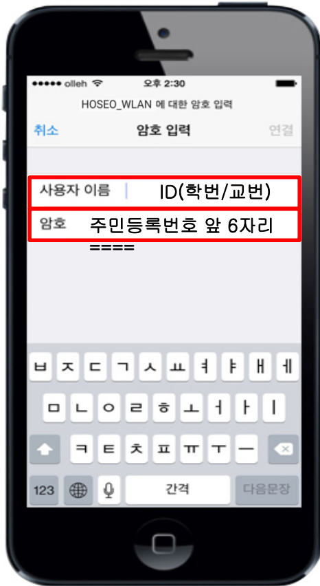
5. ID,패스워드 입력