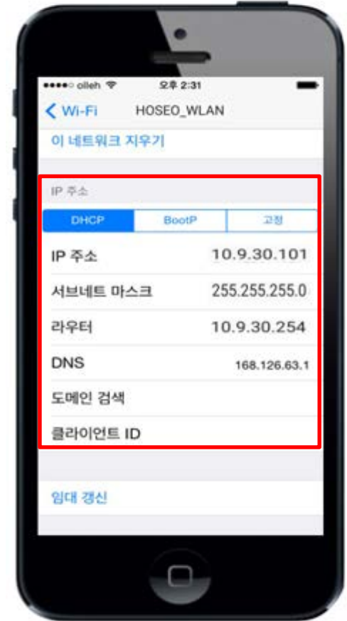
7. HOSEO_WLAN 연결 상태 확인