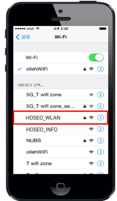
3. HOSEO_WLAN 선택